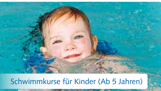
Schwimmkurse für Kinder (Ab 5 Jahren)