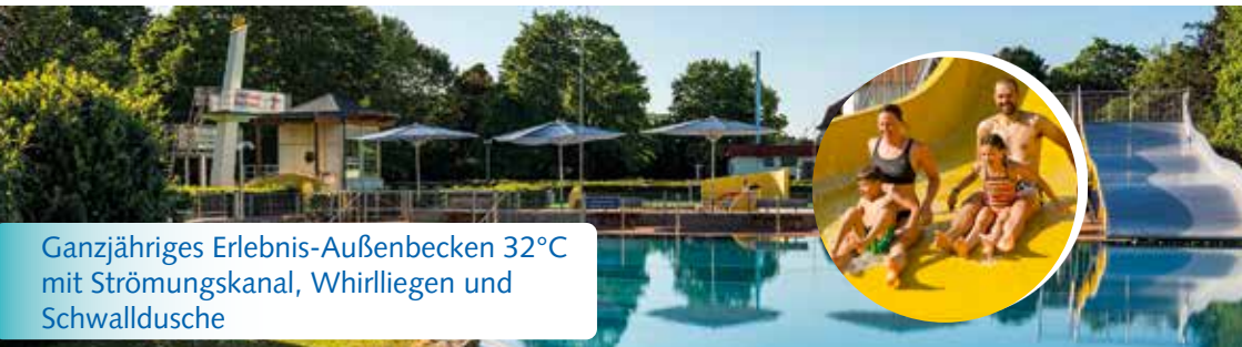
Ganzjähriges Erlebnis-Außenbecken 32°C mit Strömungskanal, Whirliegen und Schwalldusche