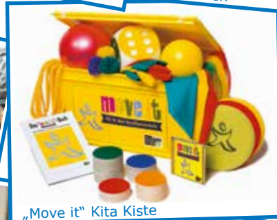
„Move it“ Kita Kiste